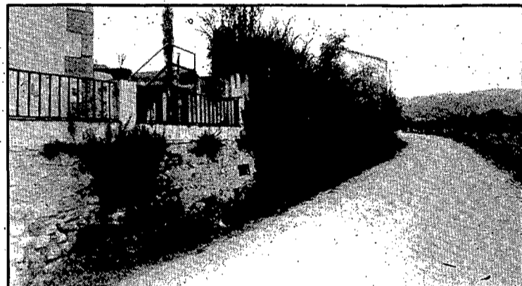
Si no fos per la placa clavada a la paret de la casa, hom creuria que, en lloc d'un carrer, es troba en un caminet de la Vall de Sant Daniel.