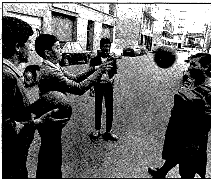
Un carrer enmig del qual encara es pot jugar a pilota

El paviment de la calçada és d'aglomerat asfàltic en calent i conforma una gruixària d'uns 24