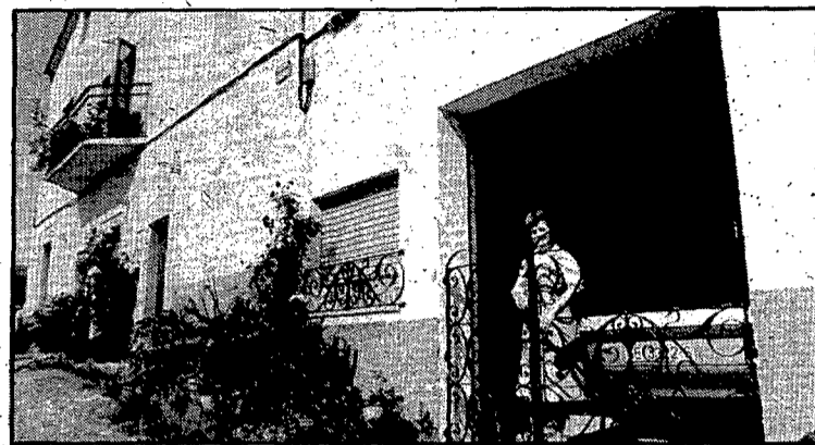
La placa que es veu sota els fils elèctrics diu: Vecindario Carmen Auguet

El veïnat de Carme Auguet, als primers anys de segle, centrava la vida administrativa i cultural de l'ex-municipi, ja que albergava l'ajuntament i les escoles a l'edifici de can Carreras. Vers l'any 1917 ambdós serveis foren traslladats als nous edificis construïts a dalt de la pujada del