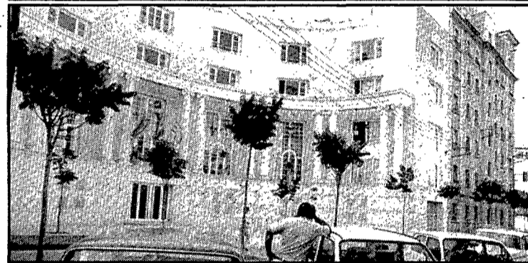
La construcció de l'edifici de la policia municipal al carrer Bacià és recent, i l'arxiu de PUNT DIARI ja comença a ser vell. S'hi conserven aquestes fotos de Joan Comalat que permeten seguir les diferents etapes de construcció de l'edifici, des del solar fins a l'acabat.

d'aquests policies, creada per l'Ajuntament democràtic sorgit de les eleccions de 1979.