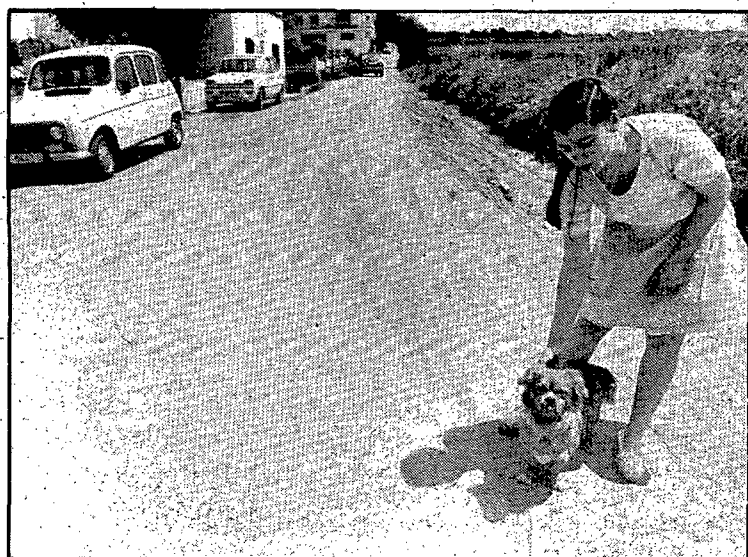
A un costat les cases, a l'altre, els camps

Una alzina centenària presideix l'entrada al carrer des de la carretera de Barcelona. Al costat