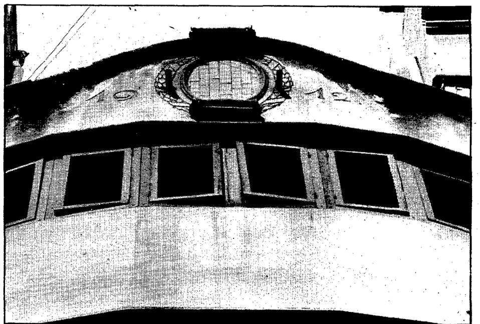
Passejar mirant enlaire proporciona inesperades sorpreses

celebrava una festa en el seu honor, i hom aprofitava l'avinentsa per engalanar la fornícula. L'esmentat J. Grahit i Grau explica que en temps de manca de pluja, els veïns organitzaven un processó fins a l'església de Montfullà per sol·licitar el benefici d'un bon riuxat i hi portaven la imatge de la seva patrona, Santa Anna.