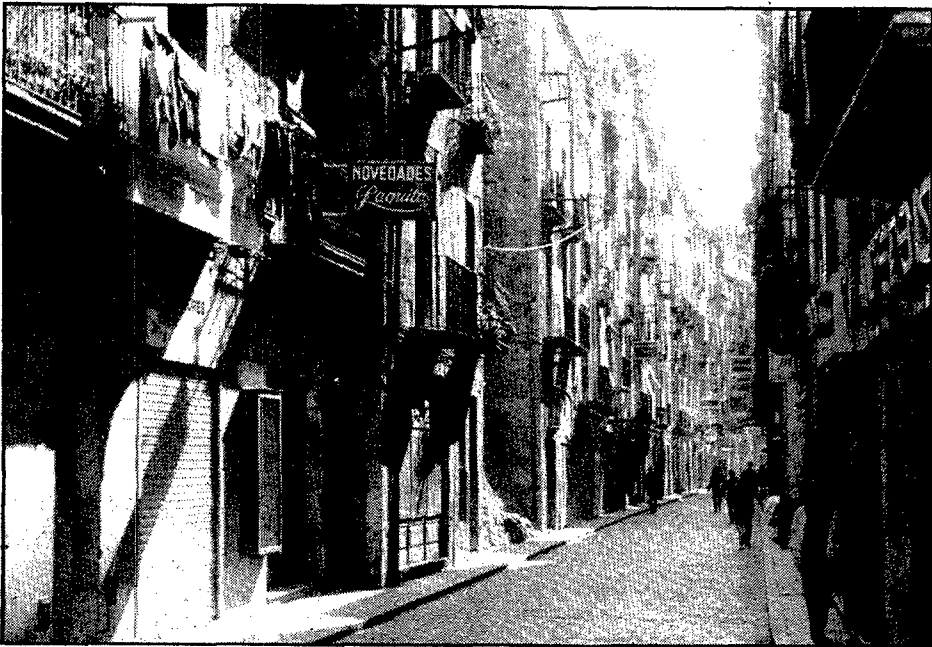
El carrer, quan no hi ha cotxes, és un dels indrets més característics de la Girona grisa