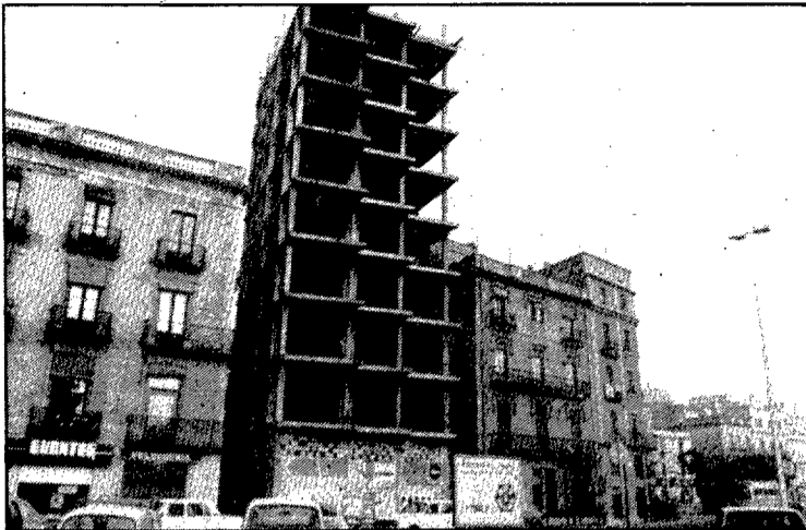
Una imatge per a la història, una foto irrepètible: un bolet que va créixer més del compte. El seu costat es veu clarament l'entrada al carrer de Banyoles