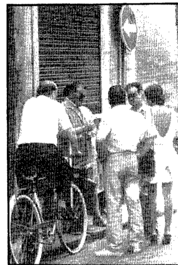
El carrer té un ambient i un personal característic

Sabem que durant el segle XVII s'estatjaren en una casa d'aquest carrer les monges caputxines, i segons Grahit i Grau hi hagué una altra casa ocupada per un tal Comas —conegut per dedicar-se a muntar els envelats de festa major— i que al segle XIX era seu de l'escola normal. Actualment, a un costat del carrer hi ha una font pública feta l'any 1914 i que ens dona la pista per situar on era l'antiga escola Normal; en aquesta data en apressar-ne la seva construcció el regidor V. Leal deia que calia «la autorització del propietari de la casa de que fue antigua Normal en la citada calle, para verificar la dicha instalación en el ángulo que la forma en el edificio inmediato». Per tant, l'antiga