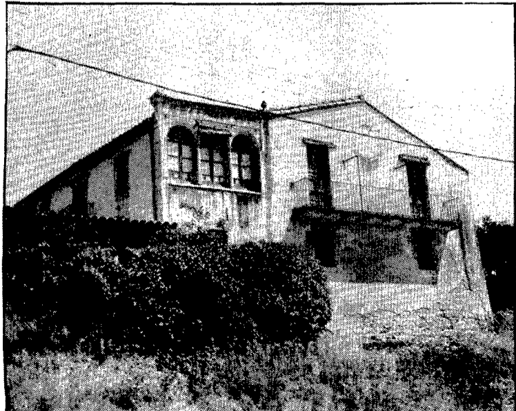
Can Ramada, un mas d'origen medieval, marca l'entrada al carrer pel tros encara sense urbanitzar de la carretera de Sant Feliu