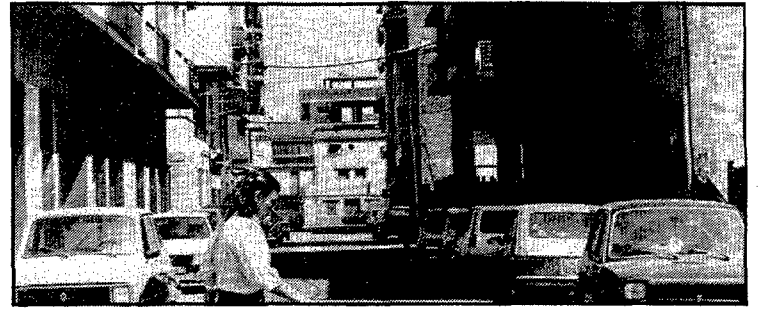
El carrer és de doble direcció, però no hi ha problemes de trànsit importants

forma característica de mugró, el fet que sigui visible des de molts indrets i constitueixi a la vegada un magnífic mirador, i les característiques no excessivament difícils però indubtablement gens avorrides de la seva ascensió, l'han convertit en visita obligada de qualsevol gironí que estimi la muntanya.