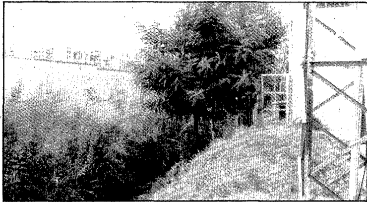
El riu Güell al seu pas pel carrer de Bilbao és poca cosa més que un rec

del barri del pla de Girona és patent en el carrer de Bilbao que ara comentem. A l'entrada per l'avinguda de Sant Narcís hi ha els tallers mecànics de l'empresa Comexi, que ocupen tota una illa de cases d'una banda del carrer i a l'altra banda hi tenen magatzems i aparcaments. L'illa de cases, següent, entre els carrers transversals d'Empúries i del Roselló, és ocupada per blocs de pisos. Els del costat esquerre són fets ja fa anys i els de la dreta tot just s'estan acabant de fer. L'última illa de cases, entre els carrers del Roselló i de la Costa Brava és encara diferent a les altres dues. Al costat dret hi ha les naus, abandonades des de fa una dotzena d'anys i en estat ruïnós, d'una antiga fàbrica de bigues de ciment. Al costat esquerre hi ha casetes unifamiliars, fruit d'una parcel·lació realitzada fa uns vint-i-cinc anys. Finalment, més enllà del carrer de la