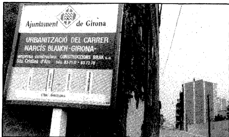
El tros del passatge més pròxim a la carretera de Barcelona ha estat urbanitzat fa poc.

El nom de Narcís Blanch se li va posar en el ple municipal del 4 de novembre de 1960, al mateix temps que tots els carrers amb nom de província espanyola situats a l'altra banda de la carretera de Barcelona i la via del tren, que aleshores es començaven a urbanitzar. El passatge Narcís Blanch s'acabava d'obrir aleshores, segons especifica l'acord municipal, «entre la carretera de Barcelona y terrenos de cultivo del Manso Montiel».