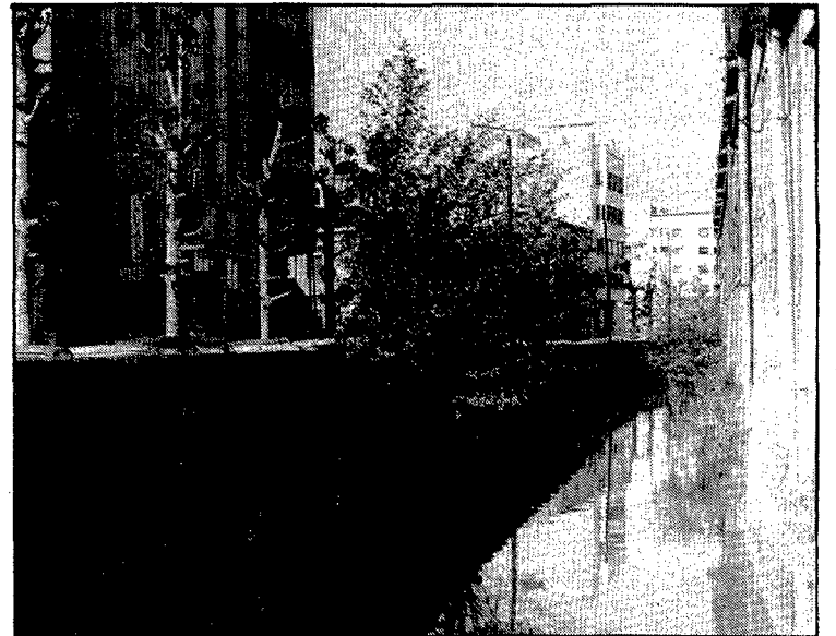
La sèquia Monar porta problemes al carrer, però també li dona un toc pintoresc.

També cal destacar que fent cruïlla amb Canonge Dorca, al costat de la sèquia Monar hi ha