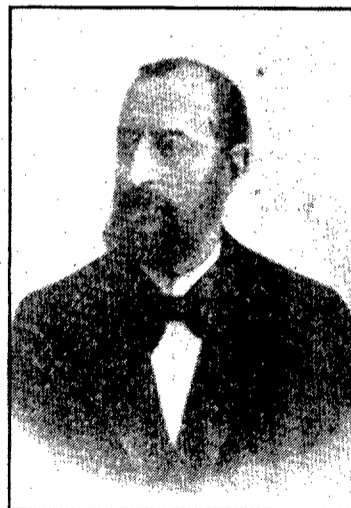
Joaquim Botet i Sisó