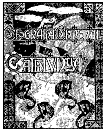
Portada de l'edició original del volum de la Geografia General de Catalunya dedicat a la província de Girona que va dirigir Joaquim Botet i Sisó