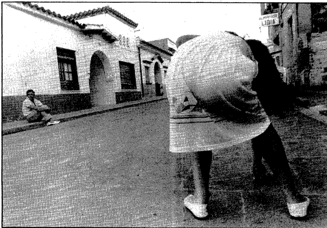
Un carrer on encara és possible jugar a la xarranca al mig de la calçada sense por dels automòbils.

De la seva actuació en el camp de la política i de les idees catalanistes, també cal dir-ne quatre coses. Botet fou el capdavanter del moviment catalanista a casa nostra des de la presidència del Centre catalanista de Gerona i sa comarca , alhora que estengué el seu ideari mitjançant el diari Lo Geronès . Amb tot, cal destacar que en Botet i Sisó definí l'any 1896 la nacionalitat catalana en una conferència al Centre Catalanista, avançant-se en deu anys a l'obra fonamental d'Enric Prat de la Riba. Aquesta conferència fou publicada amb el títol Formació de la Nacionalitat Catalana . A més a més, Botet representà el districte de Santa Coloma de Farners a la Diputació del 1883 al 1886, i fou tinent d'alcalde de l'Ajuntament de Girona del