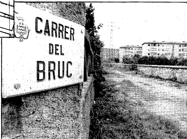
Un corriol entre la barana del Güell i els darrers de les cases de Sant Narcís

Pel que fa al tros que porta el nom del Bruc, no és pròpiament un carrer, encara que una placa col·locada arran de terra així ho