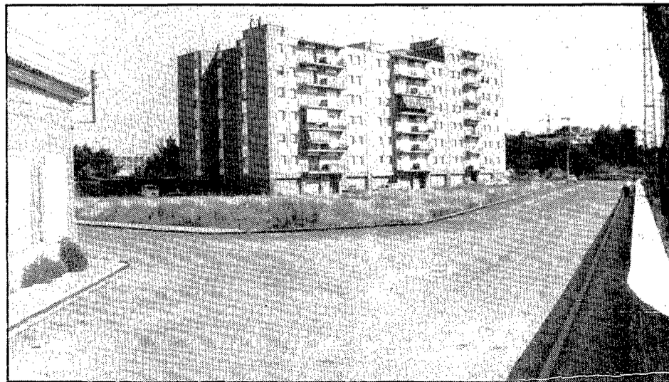
Sis anys separen aquestes dues imatges del tros més nou del carrer del Bruc. El canvi ha estat important. A la foto de l'esquerra, l'únic bloc del barri de Can Gibert situat a la banda del carrer del Bruc, quan s'estava construint, el mes d'abril de 1978. Al seu davant hi ha encara la masia de Can Gibert, camps i el carrer sense urbanitzar. A la foto de la dreta, presa ahir mateix, el bloc ja és acabat, el carrer urbanitzat i la masia ha desaparegut. A l'esquerra, entre el bloc i les dependències de l'escola de Sant Narcís, que apareix a l'extrem, es veu un tros del pavelló del GEIEG, que no era construït encara quan es va fer l'altra fotografia. I al fons, a la dreta, hi ha força més pisos. La zona verda de davant del bloc és la que recentment ha estat cedida a l'Ajuntament.