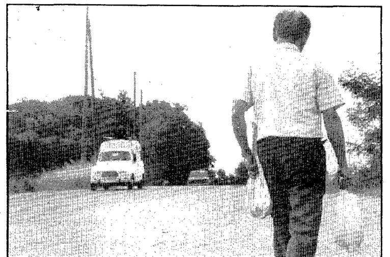
Un carrer on encara és possible anar-hi a caçar cargols

Si bé el carrer roman sense construir en la immensa majoria del seu trajecte, a partir del segon tram comencen a sovintejar les edificacions aïllades a banda i banda, configurant l'altra característica d'aquell indret: el creixement de les urbanitzacions amb una tipologia edificatòria basada en l'habitatge unifamiliar aïllat, voltat de jardí privat, en forma de ciutat-jardí. La urbanització anomenada de les Torres de Palau o Tennis, per haver nascut els anys seixanta al redós de