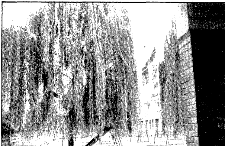
Les dues cares d'un carrer partit pel mig: a la banda de Can Gibert, la frondositat dels salzes refresca el pati interior; a la banda del passeig d'Olot, manca de voreres, fang, clots, ni un arbre. D'aquí a pocs dies, però, canviarà la cara de l'indret, ja que són a punt de començar-hi obres d'urbanització.

El carrer no és obert en la seva totalitat, sinó només en dos trossos als extrems, desconnectats entre ells. Un tros es format per dues travessies, encara sense urbanitzar, situades a banda i banda de la continuació del carrer de les Agudes a l'altra banda del passeig d'Olot, continuació que constitueix l'accés a l'escola Montfalgars i que va ser obert i asfaltat el mes de gener últim.