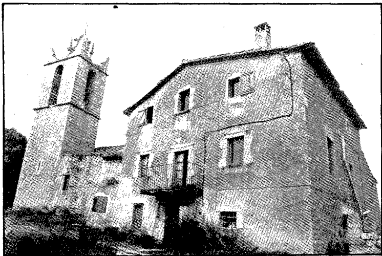
Si se segueix el carrer fins al final, quan ja es deixa la zona habitada, s'arriba a l'església de Campdorà