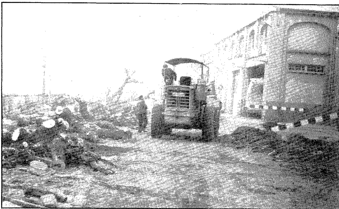
Una foto històrica: l'arboricidi perpetrat fa una vintena d'anys per realitzar la nova urbanització del passeig Canalejas. La imatge excusa qualsevol comentari

Durant anys va servir bàsicament per posar-hi les xurreries i atraccions de fires que no cabien a la plaça de la Independència durant les Fires de Sant Narcís. Com a record, hi queda encara l'única xurreria de Girona que manté la clàssica barraca a precari en lloc d'instal·lar-se de manera definitiva als baixos d'algun