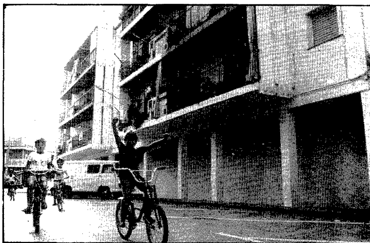
L'edifici Lluïsa ocupa tot un costat del carrer