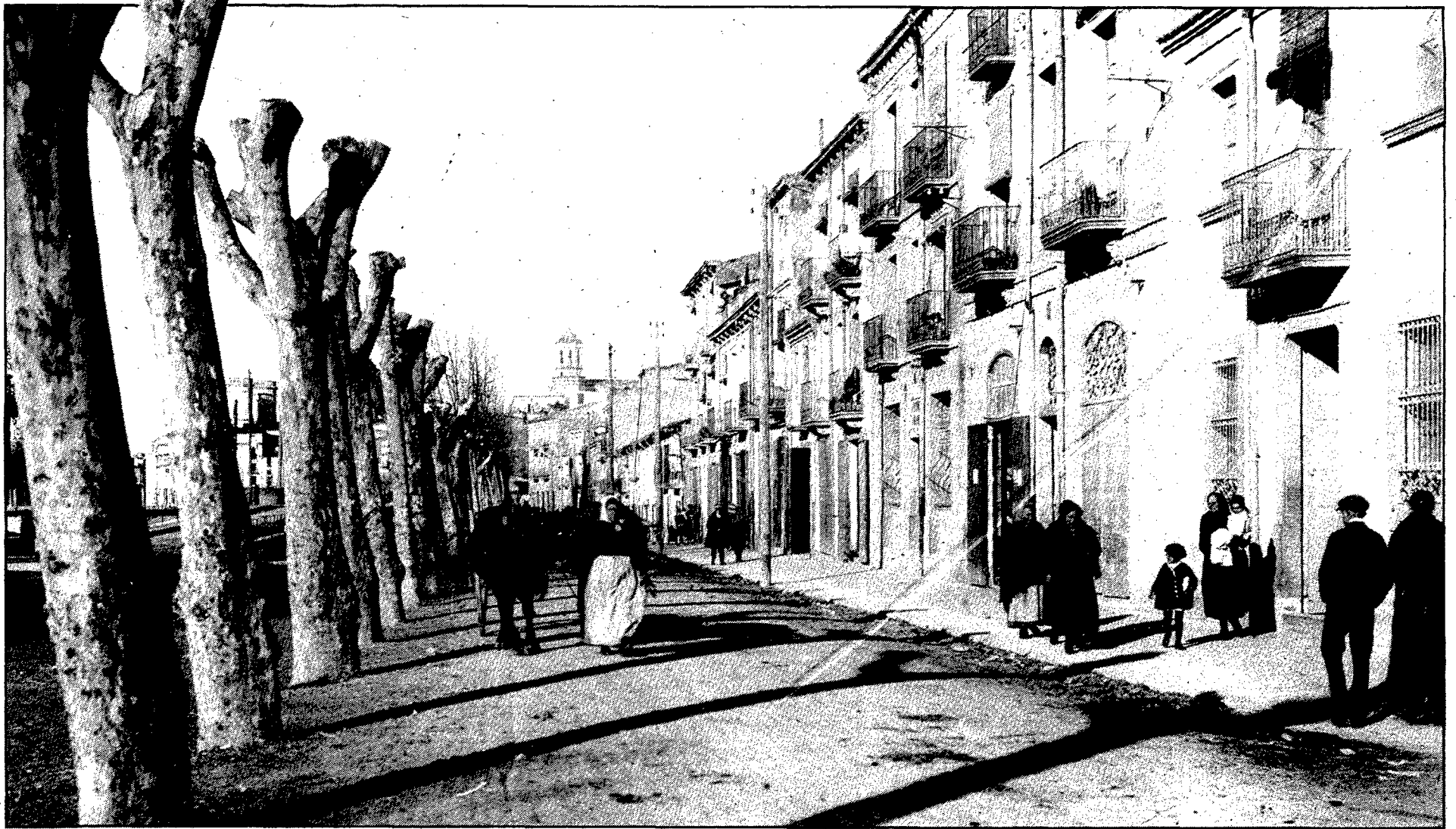
El carrer del Carme, fa cinquanta anys.

sa Valls, del número 57, traçada pel mateix arquitecte (1927). En un altre sentit, no podem oblidar el popular Centre d'Unió Republicana, situat al número 23, que va ser presidit per homes com Pere Cerezo. Era un local polític, però orientat també en sentit recreatiu, com els vells camins de poble. S'hi discutia de política, s'hi bevia i s'hi ballava. Tenia socis i, vers l'any 1929, hom aprovà el projecte d'organitzar-hi una escola primària per a nens i nenes i d'ampliació d'alguns ensenyaments per a adults. Aquest estatge, espaiós i gran, fou escriturat el 1908 a favor de la Unió Republicana pel seu antic propietari, l'industrial Leonci Torroella. Després del 1939 va ser requisat i utilitzat per l'exèrcit. L'any 1980, com que presentava un estat força ruïnós, el primer Ajuntament de