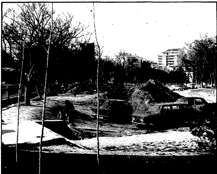
Les obres de construcció del col·lector van capgirar, l'any 1973, el paisatge del carrer.