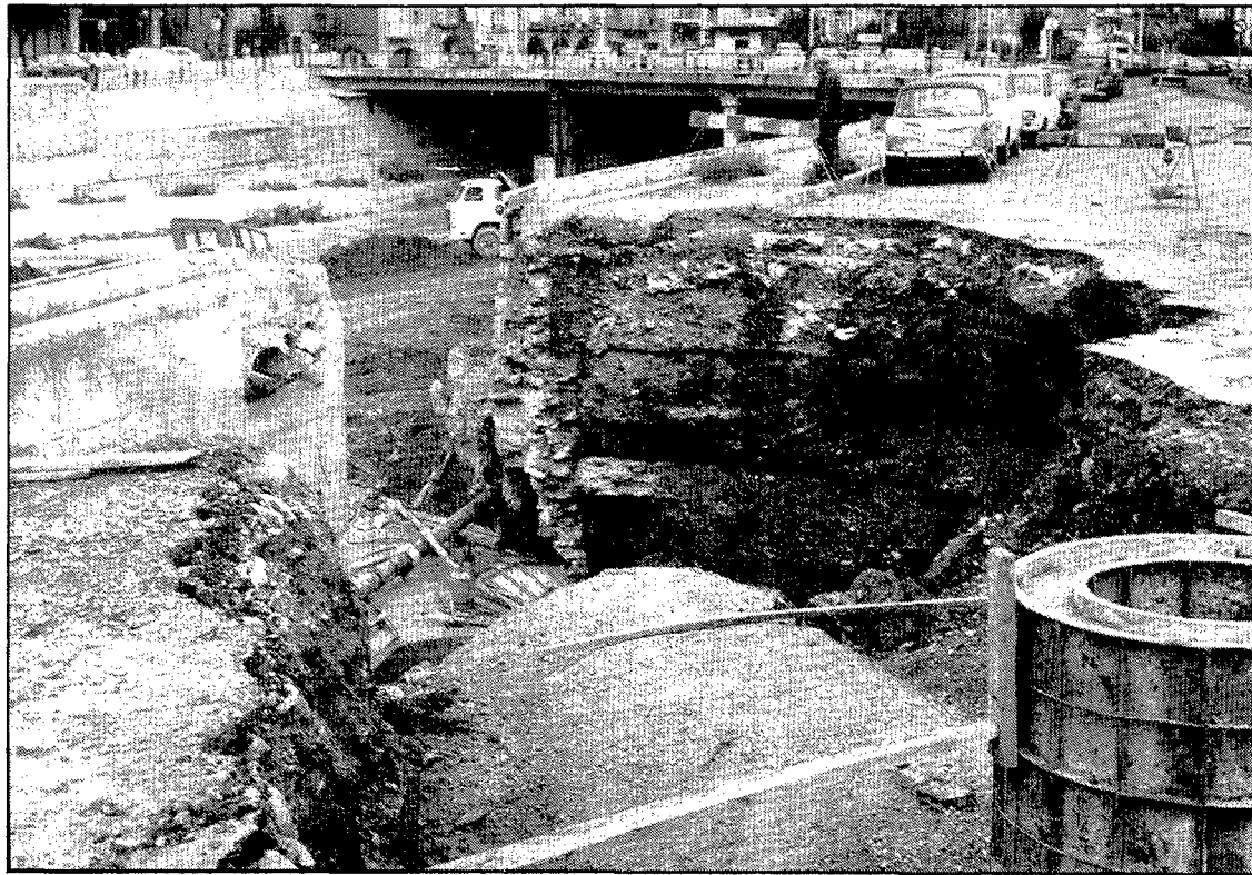
Sortida del col·lector, en plenes obres de construcció, el mes de setembre de 1973. Observi's la manca de barana ran del riu.

Els ponts constitueixen un dels elements definidors del carrer, però no sempre en sentit positiu. El primer que avui hi trobem, anant a contra corrent, va ser inaugurat el mes de juny del 1971 i fou construït per la secció hidràulica del ministeri d'Obres Públiques. És per a vianants i substitueix el que oficialment rebé la denominació d'alferes Huarte en memòria del personatge que perdé la vida al Güell arran de les inundacions de l'any 1940. Després hom el rebatejà com a pont de l'Areny. El primer pont de l'alferes Huarte havia estat construït el 1941 on ara hi ha el de vianants i fou en-