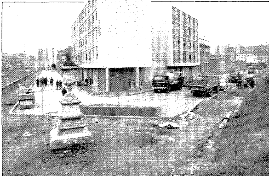
Fotografia presa el febrer de 1968, amb motiu de la inauguració de les cases del Patronat de l'Habitatge i la nova urbanització del carrer.

A la cantonada amb el carrer de Jaume Vicens Vives, s'hi ha aixecat entre l'any passat i aquest un edifici que ha estat molt polèmic perquè tapa la perspectiva que sobre la ciutat vella hi havia hagut des de la Devesa. L'Ajuntament al·lega, però, que d'acord amb el Pla Mercadal, vigent per a aquell sector, els constructors podien haver aixecat vuit pisos i l'Ajuntament,