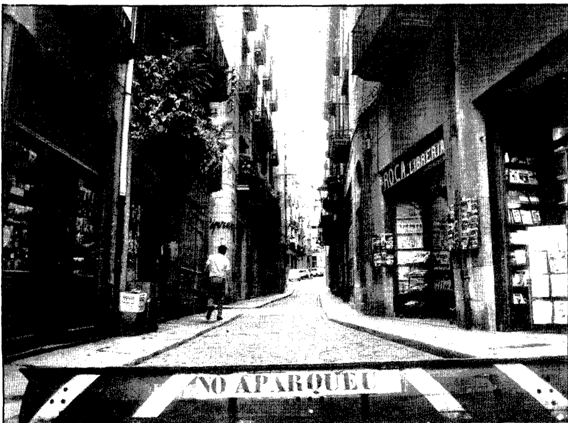
Molta gent es creu que la Força comença a la plaça de l'Oli, i ignoren que el primer tros porta el nom de Carreras Peralta.