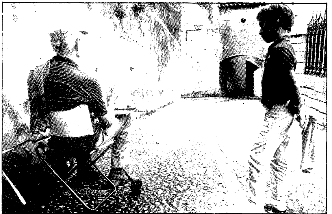
Un dels carrers més sorprenents del barri vell