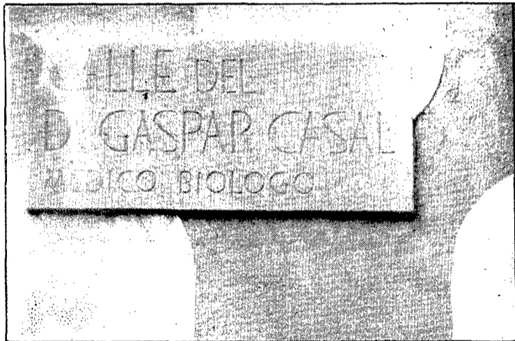
Dues plaques especials recorden qui era el metge a qui és dedicat el carrer.

tura de la plaça Pompeu Fabra, on hi havia hagut els carrers del Pavo i Caneders, i va suposar també l'entrada al mercat immobiliari de terrenys de propietat pública: el pati de l'Hospici i la caserna d'artilleria General Mendoza, on ara hi ha respectiva-