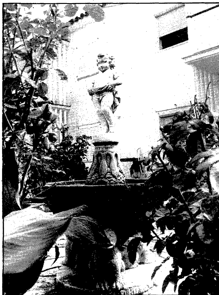
Les figuretes de pedra artificial abunden als jardins de les cases de la Grober, amb una varietat sorprenent