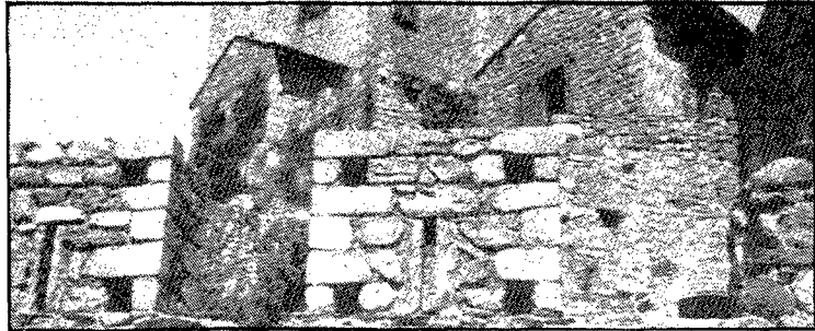
El castell de Requesens ha sofert reconstruccions molt poc respectuoses amb la història