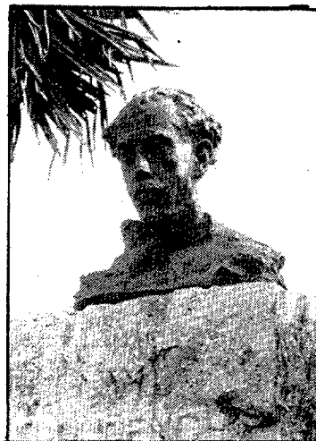
El monument a Prudenci Bertrana, posat el 1975 a la plaça