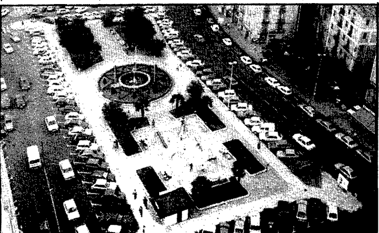
La plaça de Catalunya uneix el barri vell i el Mercadal