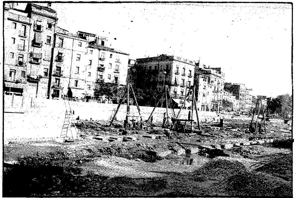
Fotografia de l'any 1966, quan van començar les obres de construcció de la plataforma sobre l'Onyar

sofert, de fet, amb el pas dels anys, notables mutilacions. L'obertura de la plaça de Pompeu Fabra on hi hagué els carrers del Pavo i Canaders, i els bolets del Pla Perpinyà havien retallat la continuïtat de les voltes de la rambla de Pi i Margall. La cobertura del riu, amb la consegüent desaparició de la barana que limitava un costat de cadascuna de les dues rambles situades a cada costat va acabar de fer-los perdre bona part de la seva personalitat i avui són cada cop més integrades en un marc comú. Tanmateix, són aquestes dues vies urbanes les que constitueixen el passat de la plaça, conjuntament amb l'espai ocupat pel riu i on es va fer durant segles el mercat de bestiar. Per això ens cal parlar-ne amb deteniment.