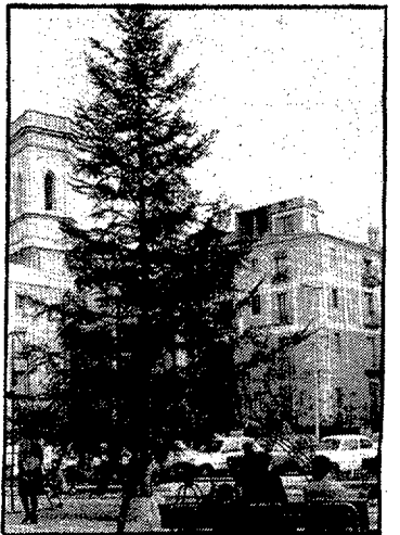
Cada any es posa l'arbre de Nadal al bell mig de la plaça