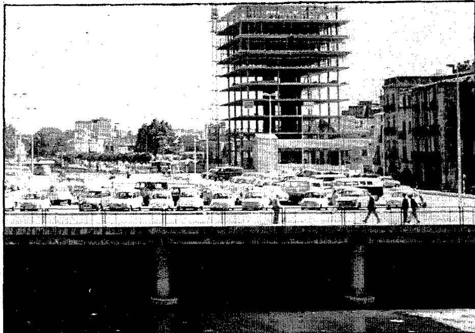
La plaça de Catalunya, quan s'hi començava a construir el primer dels gratacels del Pla Perpinyà. Encara es veuen restes de les antigues edificacions