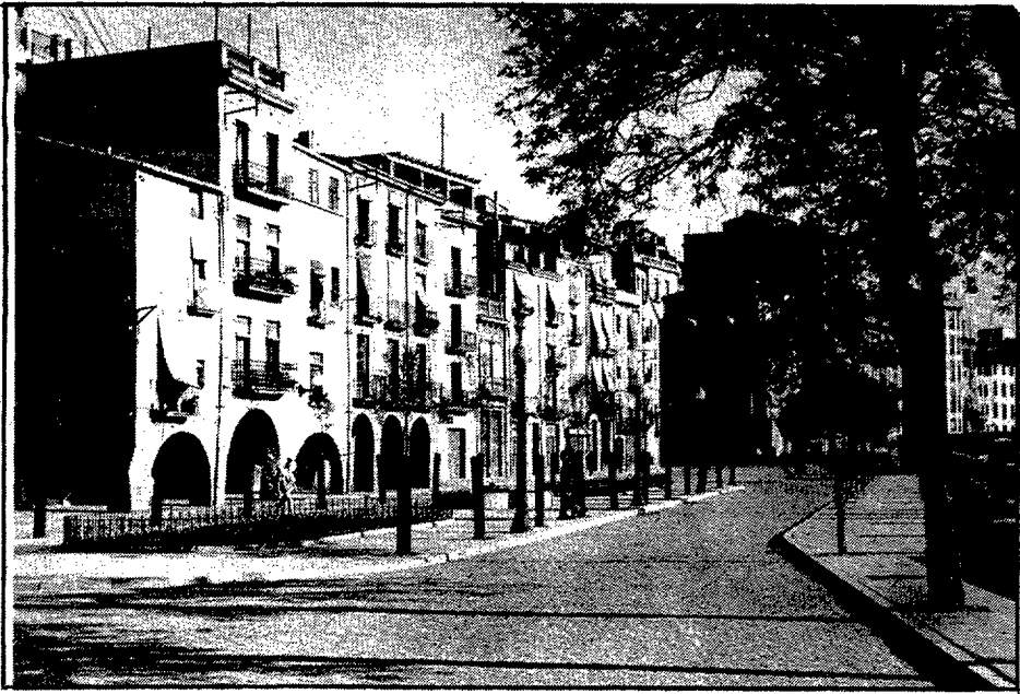
La Rambla de Pi i Margall, després de la urbanització que s'hi va fer l'any 1952, quan encara no hi havia la plataforma sobre l'Onyar