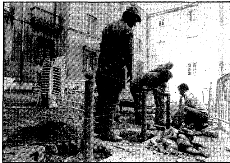
Ara fa un any va acabar-se la presència de cotxes a la plaça, que n'ocupaven una bona part i n'enlletgien les perspectives. La solució fou posar, a començaments de novembre de l'any passat, unes estaques, tal com recull la fotografia de la dreta