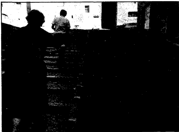
La part més alta de la pujada a la Catedral condueix directament al museu d'Art