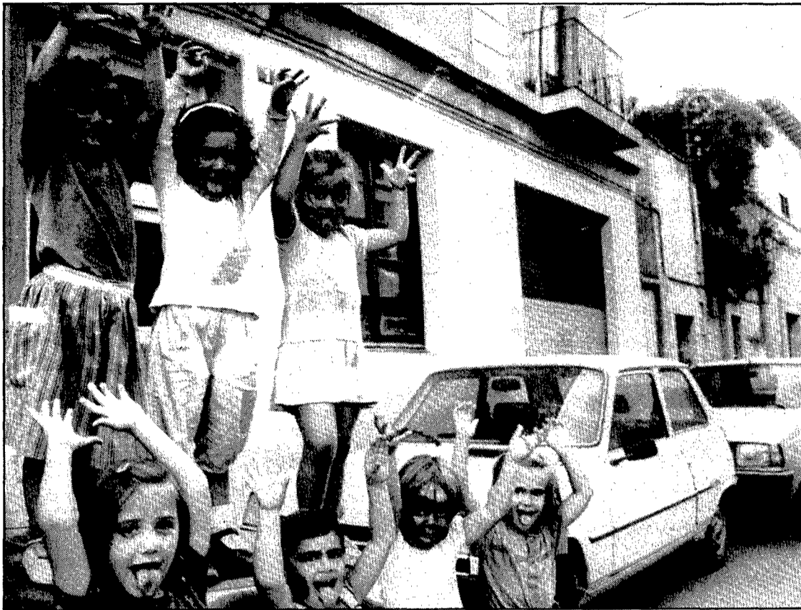
La guarderia Querubí dona vida a aquest carrer.

ment a partir de l'encreuament amb el de Figuerola. L'any 1940 només era habitat per 11 persones. Les cases conserven encara parcialment la poca alçada primitiva, i en principi havien de tenir una zona ajardinada de 5'45 m. d'amplada. El 14 d'octubre de 1921 l'ajuntament —inspirant-se en la casa construïda per Carme Vilà— acordà que les edificacions tinguessin aquesta característica, però el criteri durà poc, ja que la permanent del 18 de novembre de 1927 ho suprimí. La casa que fa cantonada amb Figuerola ens dona una idea del que podia haver estat si s'hagués seguit aquesta normativa.