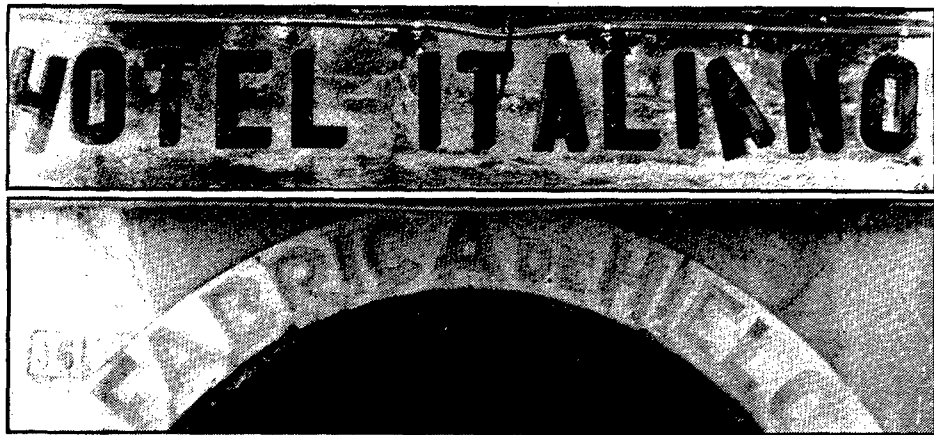
Rètols d'una altra època però que es mantenen al seu lloc, pertanyents a establiments tancats fa temps.