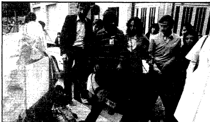
El maig de 1983 la coalició UER-NE va reivindicar el nom de Lluís Companys per a la plaça Constitució, i hi va posar fins i tot una placa. La proposta no va reeixir i l'Ajuntament va dur el monòlit amb la placa a l'edifici Cent Llars