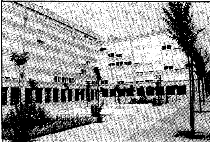
La plaça és el pati interior de l'edifici Cent Llars, a Palau