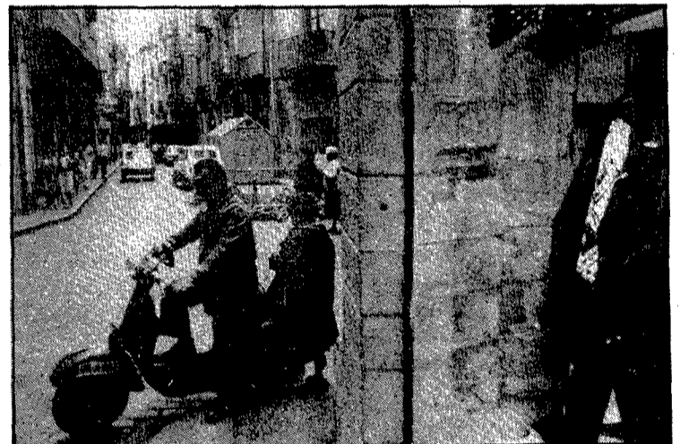
El braç del carrer de la Cort Reial més pròxim als Quatre Cantons i el carrer de les Ballesteries, vistos des de les Voltes d'en Rosés, actualment

A començaments del segle XX hi havia botigues i establiments típics com els que trobem anunciats en un guia del 1906. Al número 18 s'hi acollia «La Neotafía» de Francesc Matas, especialitzada en «grandes existencias