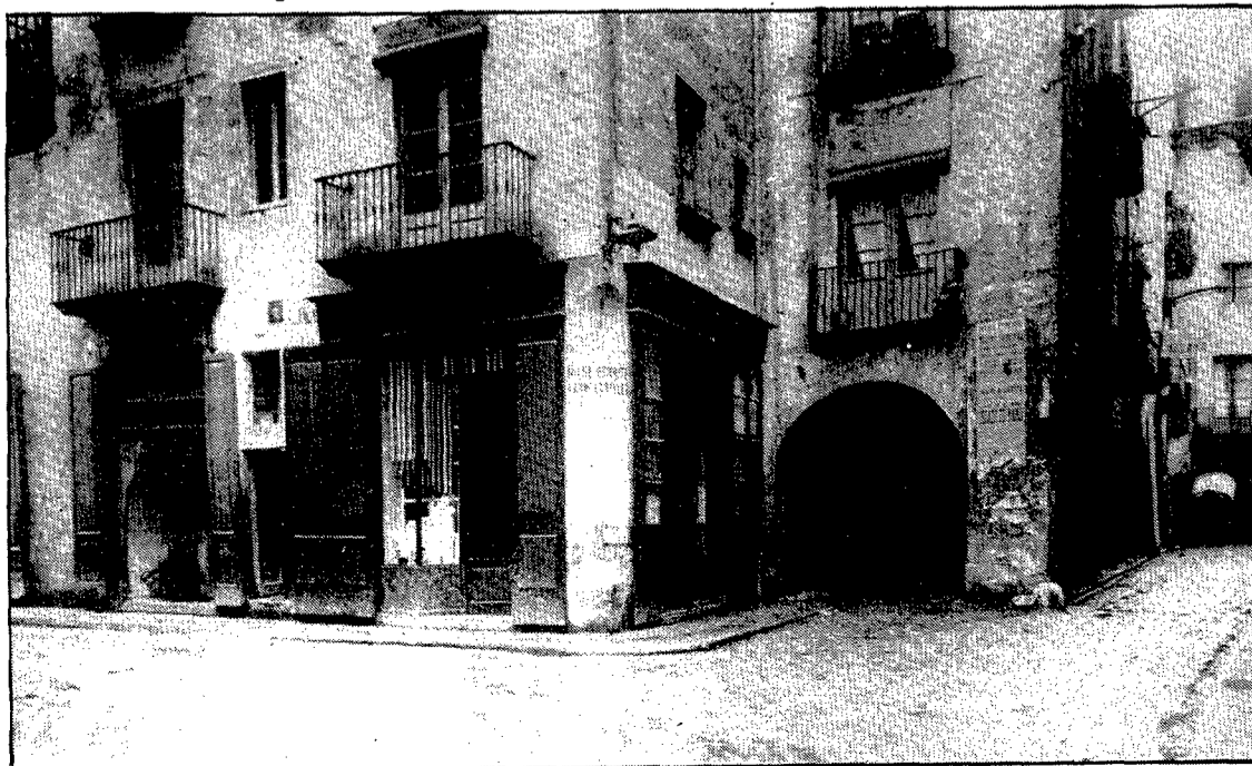
La Cort Reial i les Voltes d'en Rosés vistos des del costat dels Quatre Cantons, en una fotografia de començaments de segle

Avui els personatges que vivifiquen el paratge són uns altres —alumnes del conservatori de música, clients de la fonda de Cal Ros, joves que freqüenten els bars veïns—, però encara alguna porta tancada com la d'una antiga cotilleria és capaç de fer reviure temps passats.