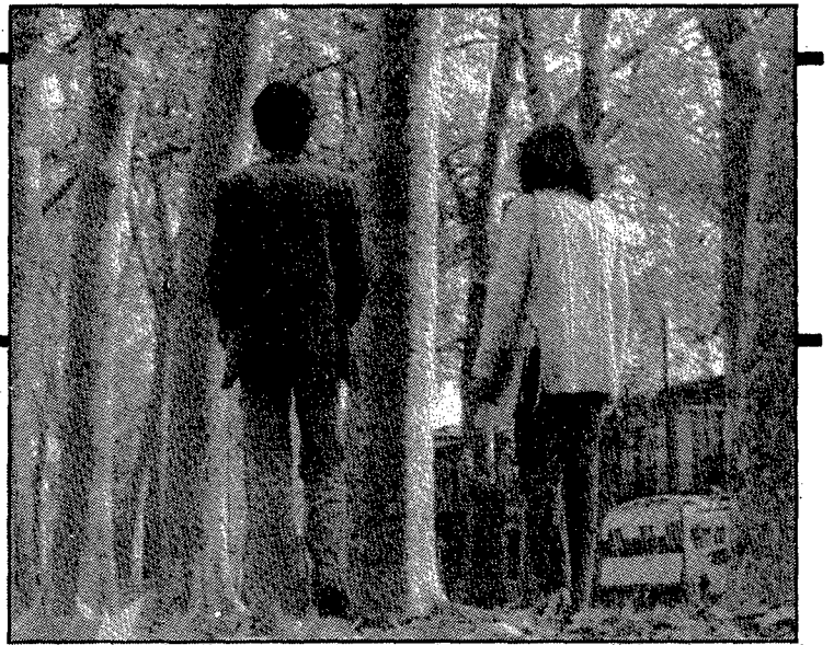
A un costat, els plàtans, per al passeig lent i reposat; a l'altre, les cases, la calçada, per al treball, el trànsit, les presses quotidianes.

De 1927 a 1928 s'ornamentà el passeig amb la balustrada de la banda més pròxima a Ramon Folch.