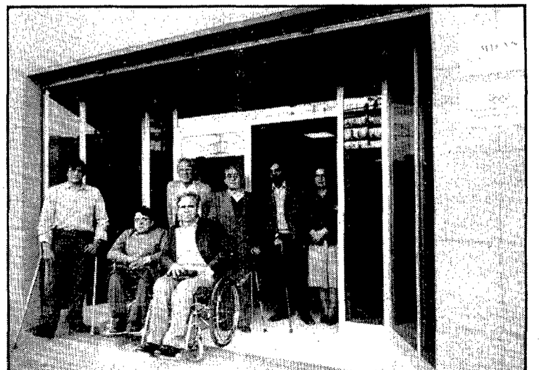
MIFAS (Minusvàlids Físicos Asociats) té la seva seu en el carrer d'Empúries