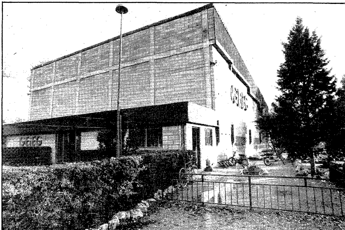
Les instal·lacions del GEIEG són les que va donar origen al nom del carrer.

Just quan l'Ajuntament de Sant Gregori va aprovar el Pla Parcial redactat per Joan Bosch, —Pla sobre el qual la Comissió d'urbanisme aplicà el silenci administratiu— el MOPU va expropiar una part dels terrenys per fer-hi passar el desviament de la N-II, que fins aleshores havia passat pel pont de la Barca. Això va revaloritzar la zona i s'hi va començar la construcció del gegantesc polígon d'habitatges. El primer bloc va obtenir la llicència d'obres el març de 1972, el