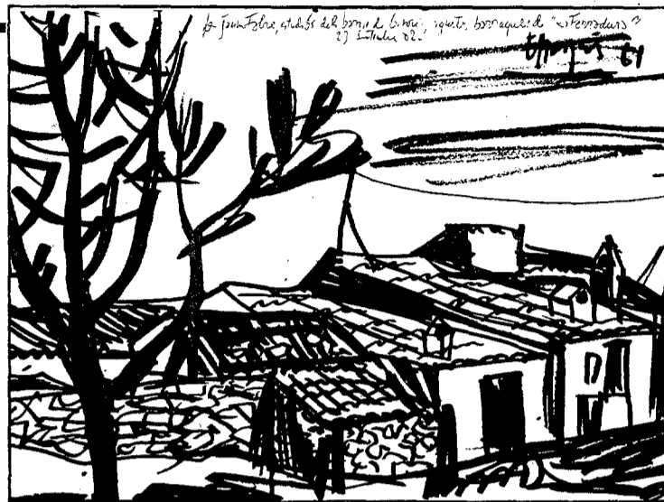
Les barraques de la Ferradura, en un apunt d'Enric Marquès fet l'any 1961