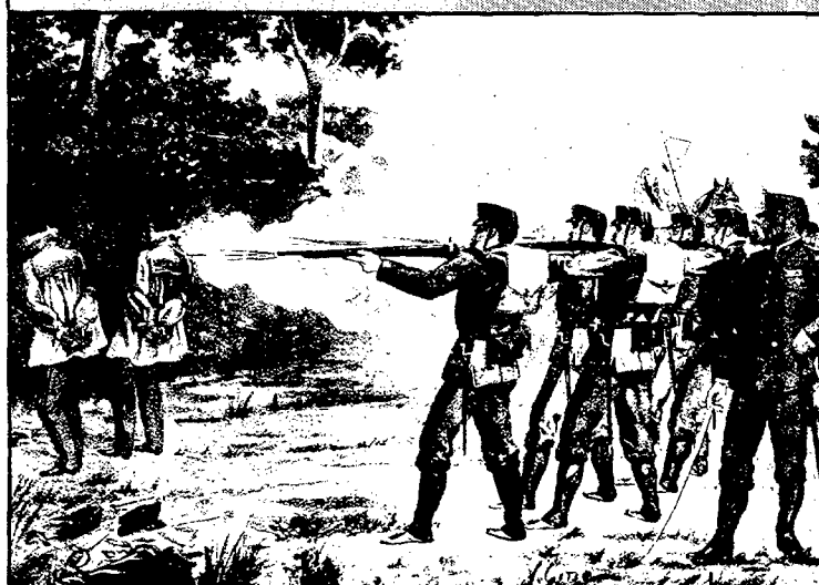
El 28 de juny de 1884, foren afusellats a Girona el comandant Ferrández i el tinent Bellés.

segà la seva vida als 34 anys. Ferrández i Bellés participaren, l'abril de 1884, en un intent d'insurrecció republicana, impulsada des de l'exterior per