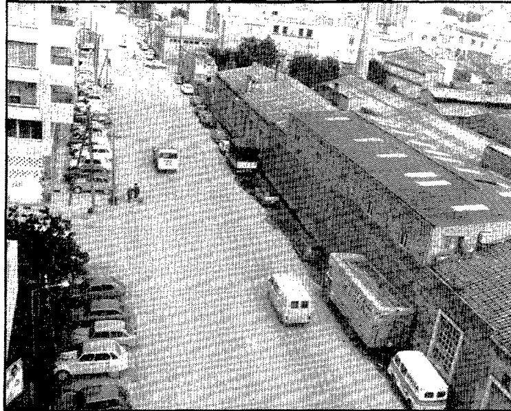
El carrer d'Emili Grahit, abans de 1982. A la dreta, les naus de la «Pagans», que aquell any foren enderrocades, i al fons, a la dreta, el cinema Orient, igualment desaparegut.

Entre les obres publicades, a part de les dues de joventut que