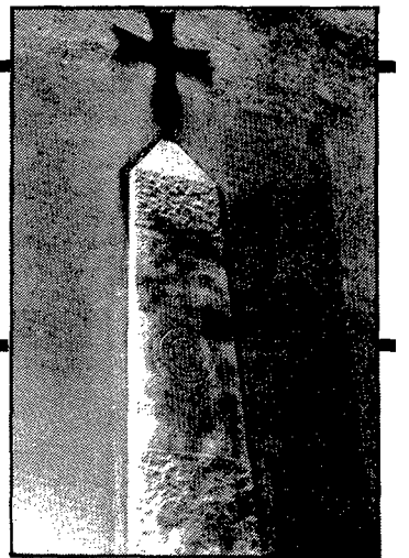
A la paret de la casa número 2 hi ha una làpida en record del primer «caído» de Girona.

El carrer és ocupat en bona part de la seva banda esquerra per la «Quinta de Salut la Aliança», i en la seva altra banda, per cases de mitjana altura construïdes els anys vint i reformades i engrandides al llarg del període 1930-1935. En la concessió de