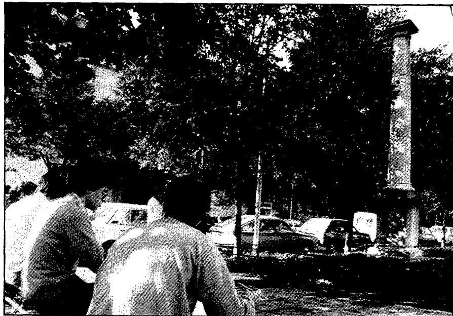
La columna commemorativa de la Constitució de 1869 havia estat abans a la plaça de la Independència i entre els desapareguts carrers del Pavo i Canaders

concretament el 1666 hom féu posar la primera pedra a un conjunt arquitectònic que des del seu començament es projecta com a centre de recuperació de malalts i com a església per al culte. De l'edifici, cal destacar el pati interior, d'una rellevant sobrietat i elegància, i que compta amb una sèrie d'esgrafiats molt notables obrats per Josep Maria Busquets, en un repertori ornamental típicament barroc realitzat l'any 1928. Es de destacar també la importància de la farmàcia —actualment restaurada— que data de la darrer part del segle XVII i començaments del XVIII, i que conserva uns 350 pots d'apotecari i una remarcable col·lecció d'instrumental quirúrgic.