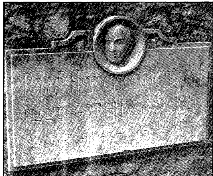
El monument al pare Butinyà queda situat en el nivell superior de la plaça, en un racó molt poc conegut.