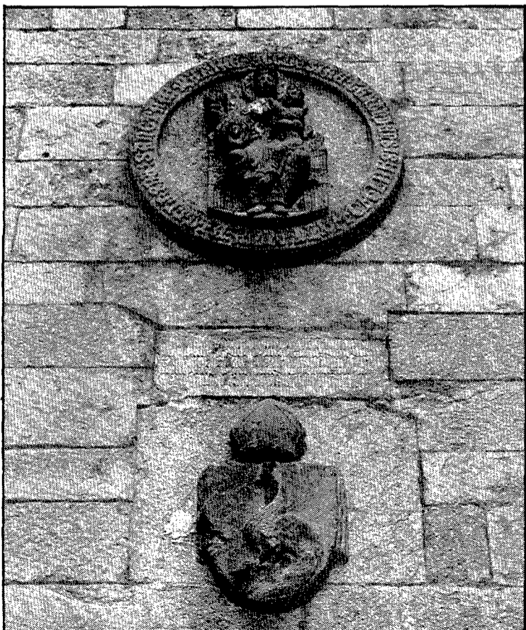
La font dels Lledoners, una peça de museu.