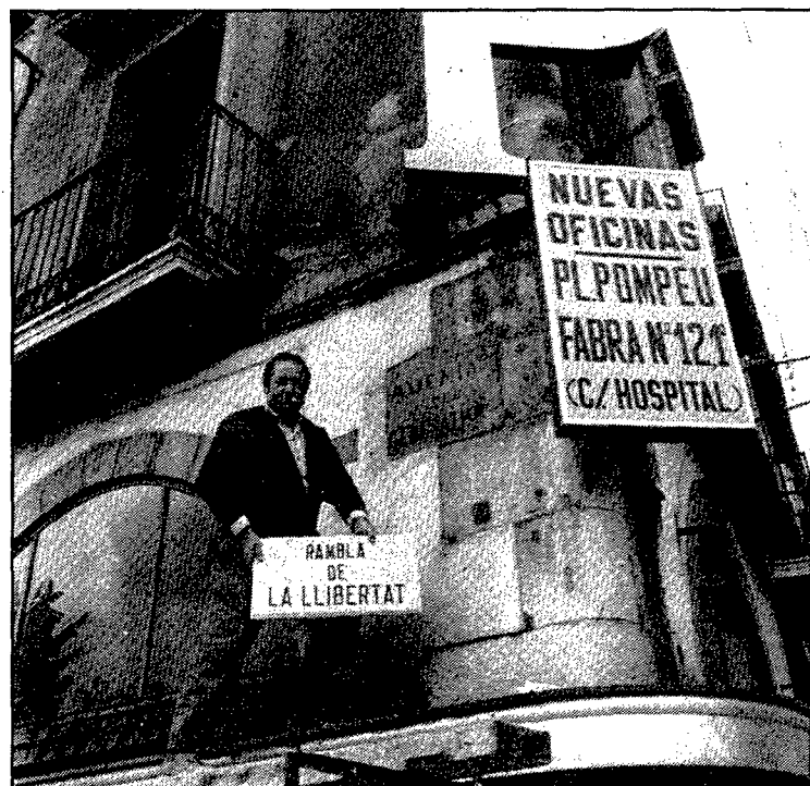
La desaparició del nom del Generalísimo donat a la Rambla els anys de franquisme fou una de les primeres mesures que adoptà el 1979 l'Ajuntament democràtic.