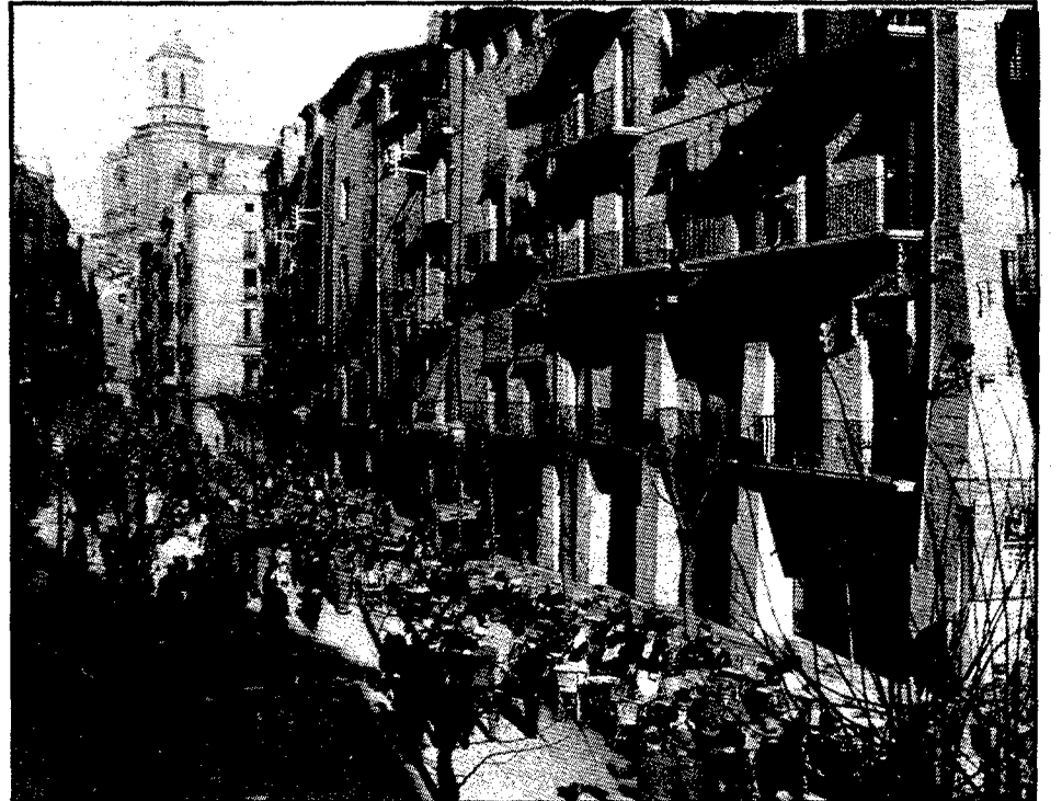
La Rambla, quan els cotxes encara circulaven ran de les voltes.

que el riu hi feia, oi més quan aleshores la plaça es trobava en un nivell molt més baix de l'actual, com ho palesen les voltes que encara resten en els baixos i soterranis de diversos edificis de la zona.