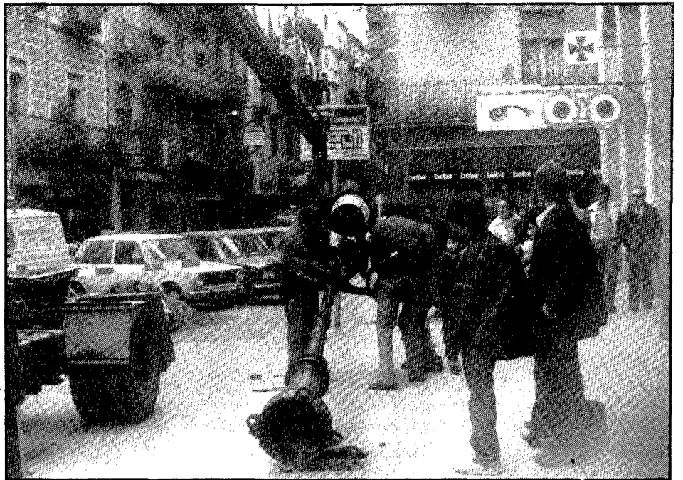
El canvi de fanals fou un episodi complex que heretà l'Ajuntament democràtic i que va suposar un cert perjudici econòmic a l'erari públic.

— oficialment, és clar, — de l'actual Rambla de la Llibertat.