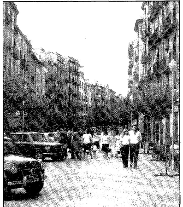
La Rambla dels anys seixanta, quan els cotxes encara aparquaven sobre el passeig central. Una fotografia impagable, reflex de tota una època: els sis-cents, els vestits, els til·lers acabats de plantar...