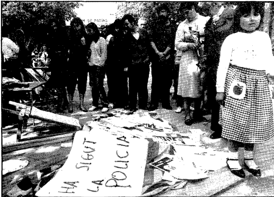
El dia del llibre de l'any 1982, la policia va trabucar la parada que el PSAN havia muntat a la Rambla. El cor de la ciutat va veure alterada, un cop més, la seva pau. Els principals moments de la vida política de Girona han tingut com a escenari la Rambla.