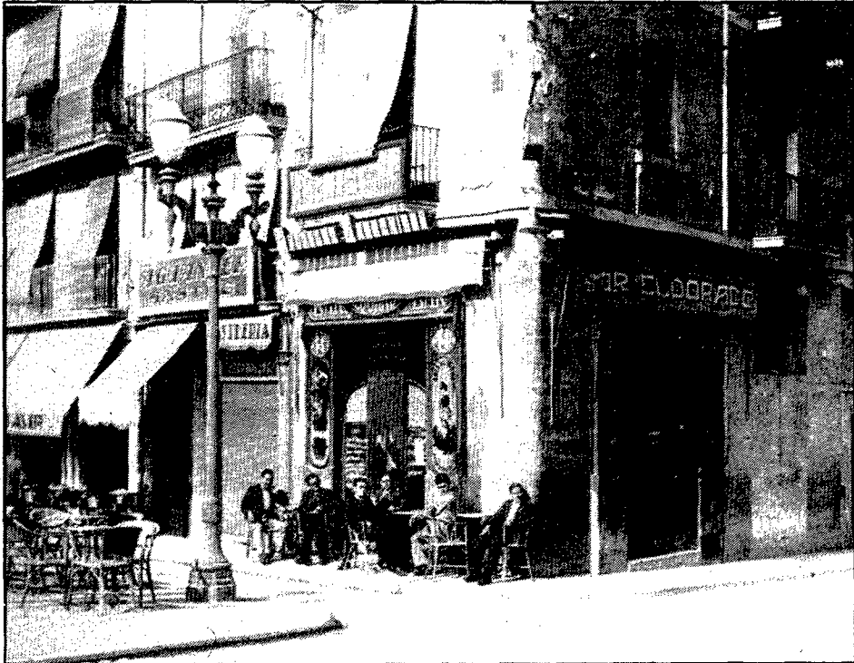
La cantonada de la Rambla amb la pujada al Pont de Pedra, irreconeixible en una fotografia de fa ben bé cinquanta anys