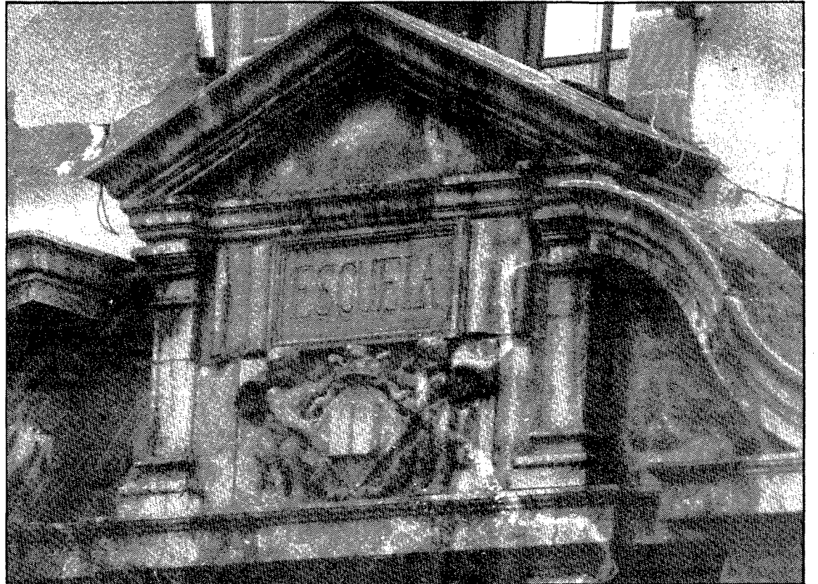
La porta d'entrada del col·legi verd fou realitzada en pedra artificial pels tallers Sagrera, situats també al carrer Lorenzana.