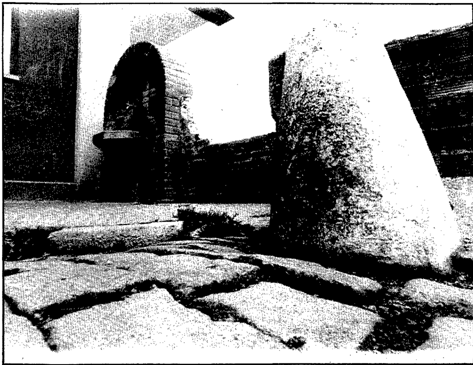
Desaparegut el pont, el carrer acaba ara en un cul-de-sac on es conserva una antiga font en molt mal estat.

na, com ho recorda una inscripció de la façana.