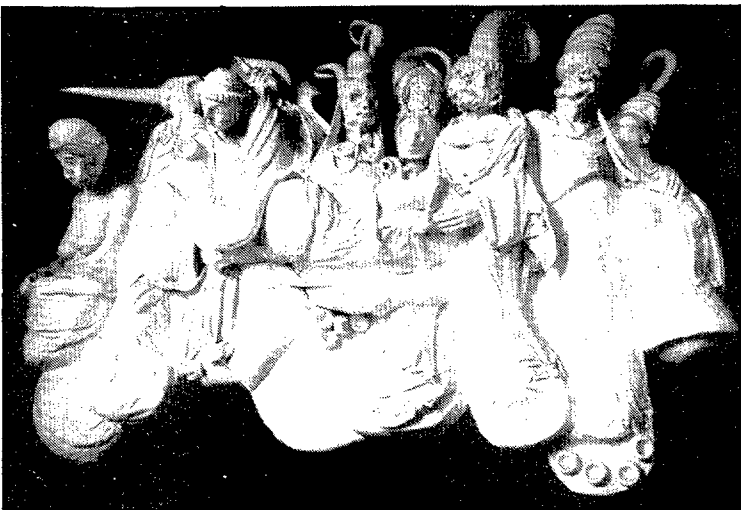
Escultures de Lluís Güell decoren l'escala principal del col·legi de Metges.

L'edifici particular més notable del carrer és la casa del número 38, bastida a iniciativa de Joaquim Pla i Cargol amb plànols de Gaietà Cabanyes (1928). L'any 1931 aquesta construcció va ser premiada per la Cambra Oficial de la Propietat Urba-