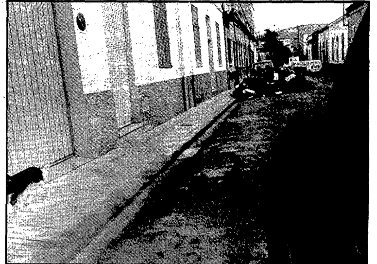
Un carrer tranquil, on encara dominen les casetes de planta baixa i hom pot passejar per la calçada sense por als cotxes.

Una curiositat del carrer de la Mare de Déu de Loreto és l'estret passadís —just per a una persona a peu— que hi ha entre els edificis número 2 i 4 que arri-