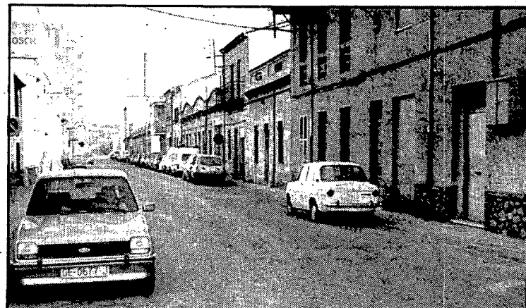
La xemeneia dels Químics fa de teló de fons a les casetes de planta baixa que caracteritzen tot un costat del carrer.

El carrer participa de les característiques de la zona en la qual s'insereix. S'hi mantenen moltes casetes de planta baixa anteriors a la guerra civil, i que constitueixen encara la nota dominant.