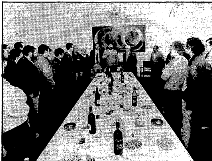
La inauguració del local de CC OO posa punt final a una llarga etapa de precaritats.