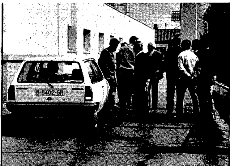
A Vidreres, els fotògrafs no van poder entrar a la RAM.