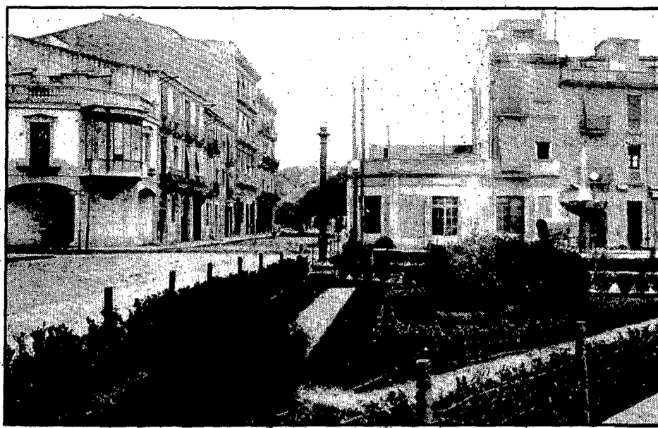
La cantonada de la ronda Ferran Puig amb la carretera de Santa Eugènia, quan la carretera de Barcelona encara es desviava cap a la Gran Via i al mig de la plaça hi havia els parterres anteriors a la plantació de til·lers al voltant del brollador. Al fons del carrer de Ferran Puig es distingeix un ramat de bens ocupant la calçada.

primers passos per a la urbanització de la primera.