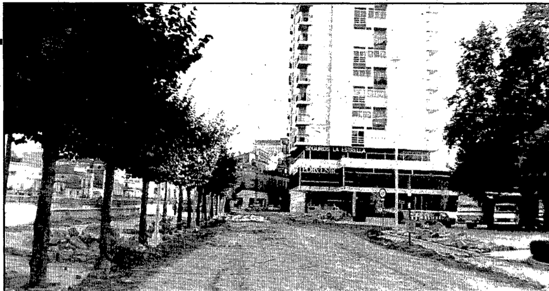
El passeig, durant les obres d'urbanització.

Hom ha criticat el mariscal Mendoza com un dels responsables de la vergonyosa rendició