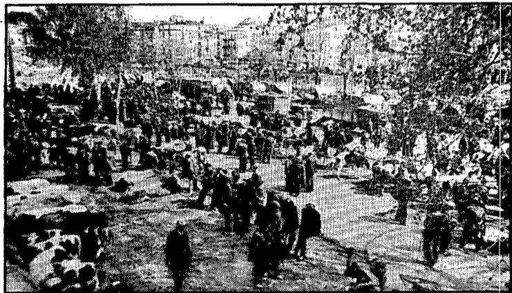
El mercat de bestiar a l'antic passeig del General Mendoza, en una fotografia de cap a 1920.

En el ple de l'Ajuntament de 17 de gener del 1930 es decidí migpartir el passeig en dos trams, de manera que l'antic tram conegut com «els passejadors» conservava la denominació de passeig de Sant Francesc i el sector més proper a l'actual plaça de Catalunya passava a dir-se'n passeig del General Mendoza. Tot i així, poc duraria la innovació ja que per acord del 28 de maig del 1931 es rebatejava el primer sector amb el nom de «passeig de Galán y García Hernández», en record dels mili-