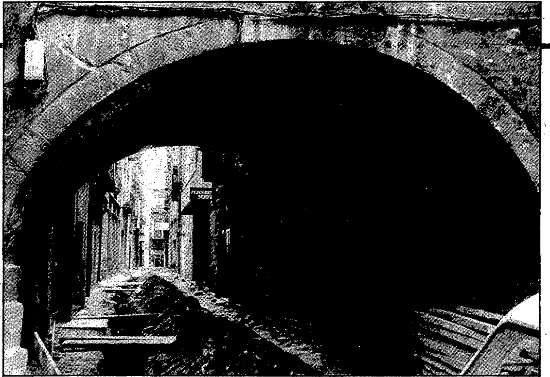
El carrer dels Mercaders, amb el paviment aixecat durant les obres que s'hi van fer l'any 1.973 (Foto: Arxiu d'imatges de l'Ajuntament de Girona).

Ja hem parlat de la bona situació econòmica i del paper protagonista jugat pels mercaders en la Girona medieval, fins al punt que resta un carrer que en perpetua la influència. Malgrat tot, sabem que la població treballadora d'aquest indret era molt més diversificada del que el mateix nom pugui indicar. L'any 1558 comptava amb una trentena d'oficis; hi destacaven els abai-